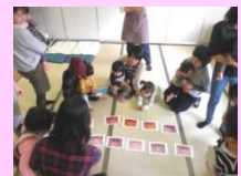
お母さん企画のお別れ会など♪