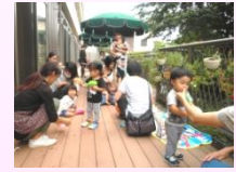
みんなで一緒にあそぼう!