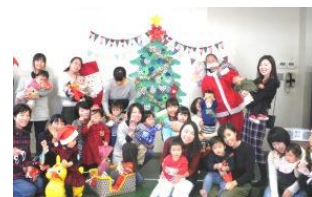
～今年のクリスマス会の様子～

【日 時】平成 30 年 12 月 4 日(火) 10:00～12:00 【場 所】厚生文化会館 2階「遊戯室」 【内 容】みんなで記念撮影(仮装歓迎♪) サンタさんからプレゼント♪など 【要予約】先着順 15組